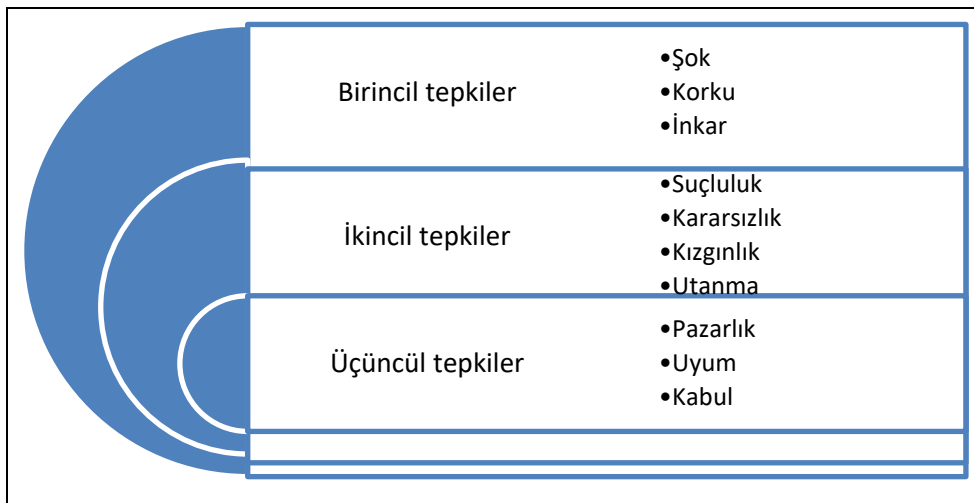
Şekil 1. Engelli çocuğu olan ailelerin yaşadığı duygular (Kaynak: Şanlı, 2012).

Engelli bir çocuğun ebeveyni olmak hem aile yapısında hem de sosyal hayatta büyük değişikliklere yol açmaktadır (Fisman ve Wolf, 1991). Ayrıca araştırmalar çocukların eğitim ve sağlık hizmeti alırken de çeşitli zorluklarla karşı karşıya kaldıklarını göstermektedir (Zengin Akkuş vd., 2021). Bu bağlamda engelli çocuğun aileye katılması ile birlikte aileler aşama aşama birçok duyguyu deneyimlemektedir. Bu süreç her ailede farklılıklar gösterse de ailelerin gösterdiği benzer tepkileri açıklamaya yönelik bazı modeller (aşama modeli, bütüncül yaklaşım, sürekli üzüntü modeli, travma sonrası gelişim modeli vb.) geliştirilmiş olup bunlardan en çok kabul gören aşama modelidir (Ardıç, 2018). Yaşanan duygular ve şiddeti aileden aileye farklılıklar gösterse de farklı toplumlarda yapılan araştırmalar genel olarak engelli çocuğu olan ailelerin süreç içinde benzer tepkileri gösterdiğini ortaya koymaktadır. Aşama modeline göre aileler ilk olarak şok duygusuyla başlayan süreçte aşama aşama kabul ve uyum noktasına gelmektedir (Cavkaytar, 2010; Şanlı, 2012). Engelli çocuğu olan ailelerin yaşadığı duygular Şekil 1’de sunulmuştur.